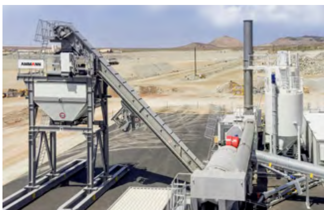
ACT 140 CONTIQUICK TRANSPORTE OPTIMIZADO