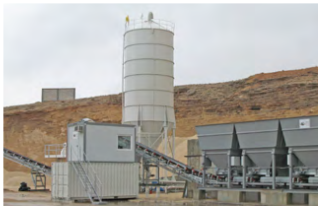
SCC 400 COLDMIX AVANZADA