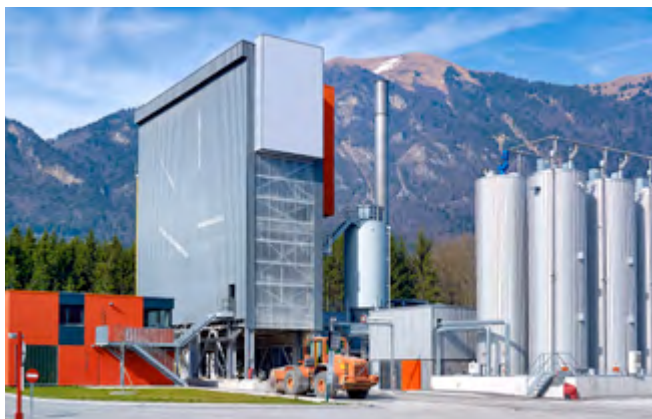
ACP 120-300 CONTIMIX PREMIUM

Las experiencias pasadas llevaron a la creación del sistema patentado «cero desperdicio» y también a separar el calentamiento de la mezcla, de manera que las recetas se pueden adaptar sobre la marcha y así evitar costos de frenado e inicio. Esos son solo algunos ejemplos y, por supuesto, vendrán más.