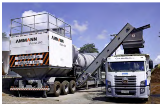
ACM 100-140 PRIME MÓVIL